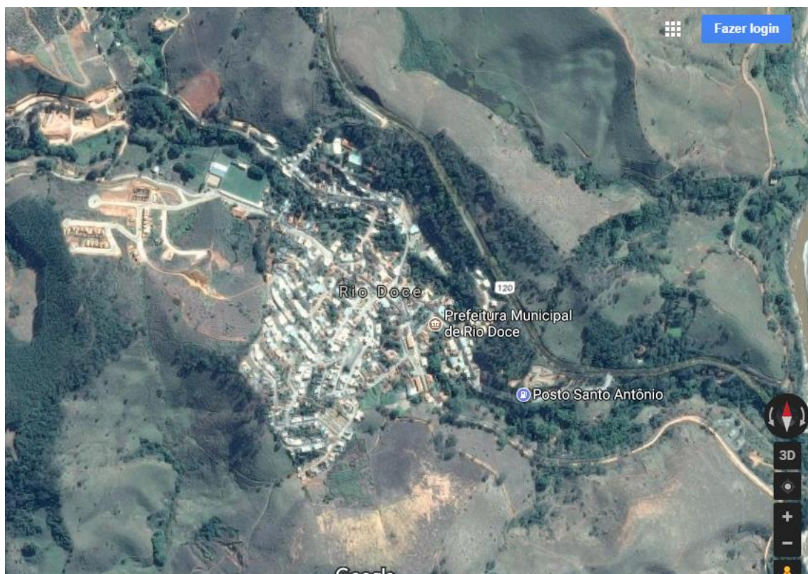
Imagem de Satélite de Rio Doce/MG